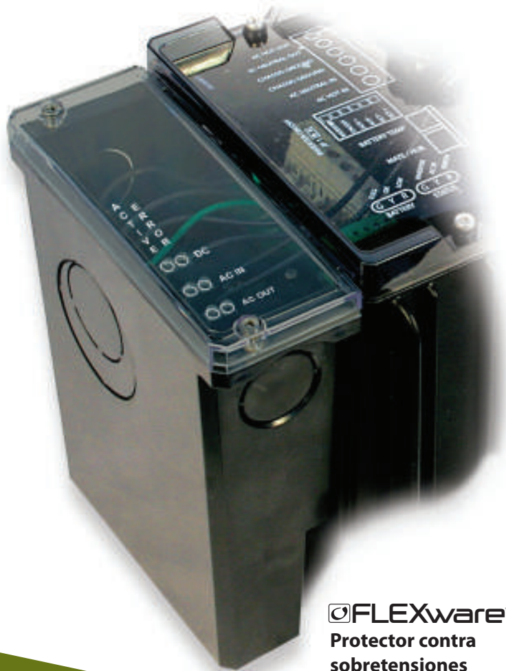
FLEXware™ Protector contra sobretensiones

El protector contra sobretensiones FLEXware de Outback Power es un componente de balance del sistema integrado perfectamente para el inversor/cargador serie FX. El protector contra sobretensiones FLEXware fue diseñado por los ingenieros de OutBack Power específicamente para los inversores/cargadores de la serie FX de OutBack y proporciona múltiples niveles de protección para los componentes eléctricos vitales del inversor/cargador en el caso de que se produzca una sobretensión eléctrica. El diseño sofisticado brinda protección para la CA y CC en múltiples circuitos (dos CA y uno CC) mediante los varistores de óxido metálico con fusibles térmicos. Los indicadores visuales de LED permiten monitorear el estado a simple vista y así los usuarios del sistema pueden determinar el estado de operación del protector contra sobretensiones FLEXware en tiempo real. El protector contra sobretensiones FLEXware está diseñado para trabajar de 120